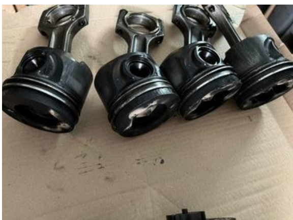
1-rasm. shatun, porshin

boshqarayotgan insonlardan eshitib qolamiz. Ai-80 benzindan avtomobilimga qo‘ygan edim, avtomobilimdan har xil shag‘illashlar, no‘malum tovushlar chiqib qolyapdi. Metan gazda unaqa bo‘lmas edi deyishadi. Bundan kelib chiqadiki Ai-80 benzinning sifati yaxshi emas.