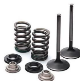
2-rasm. klapan, klapan prujenasi

1-rasmga nazar soladigan bo‘lsak cobalt avtomobiliga Ai-80 benzindan 20 litr quyib haydalgan va ikki kundan keyin cobalt avtomobili yurmay qolgan. Dvigatelga TXK uchun ochib ko‘rilsa porshinlar, xalqalar sinib qolgan. Ustalarning aytishicha Ai-80 ga ba‘zi zapravkalar gazning qoldiq kansatlaridan qo‘shib yubormoqda. Buning oqibatida avtomobillarning porshinlari, porshin xalqalari, klapanlar, gilzalar, benzin nasos, benzin filtr, injektorlar va boshqa detallarida nuqsonlar ko‘paymoqda.