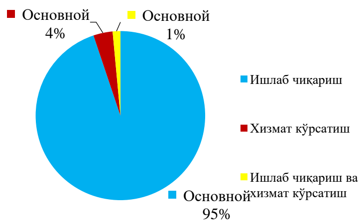
1-расм. Бир турдаги фаолият билан шуғулланадиган ногиронлиги бўлган шахслар жамиятларининг фаолият йўналишлари 1