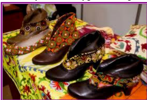
4-rasm. Kashtachilik san`ati

gap ketganda oltin, kumush, zar bilan tikilgan buyumlar majmuasi ko`z oldimizga kelishi tayin. Zardo`zlik buyumlarida chokning bo`rtib turishi buyumga alohida xusn bag`ishlaydi. Kashtachilik ming xil xususiyatga ega bo`lib, u turmushning barcha jabhalarini o`z ichiga qamrab oladi. Milliy matolarimizda aks etgan gullar, tasvirlar o`zbek ayolining ko`ngil kechinmalaridan, orzu-armonlaridan so`zlaydi. Teranroq nazar solsangiz, har bir tasvirda chuqur ma`no bor. Demak, barcha-barchasi o`z zaminimizda vujudga keladi. Bugungi kunga kelib esa, kashtachilik san`ati nafaqat san`at asari balki, o`zbekona milliy kiyimlarimizda ham o`z aksini topmoqdaki, bunday bejirim va o`ta nozik did bilan zamonaviy inovatsiyalar bilan uyg`unlashgan holda ishlab chiqarilayotgan mahsulotlarimiz nafaqat hamyurtlarimizni, balki chet el sayyohlarini ham o`ziga rom etmoqda. (4-5 rasmlar). Banday mahsulotlarni ishlab chiqarishda esa qo`l mehnatini zamonaviy innovatsiyalar bilan uyg`unlashtirgan holda olib borish hozirgi davr talabidir.