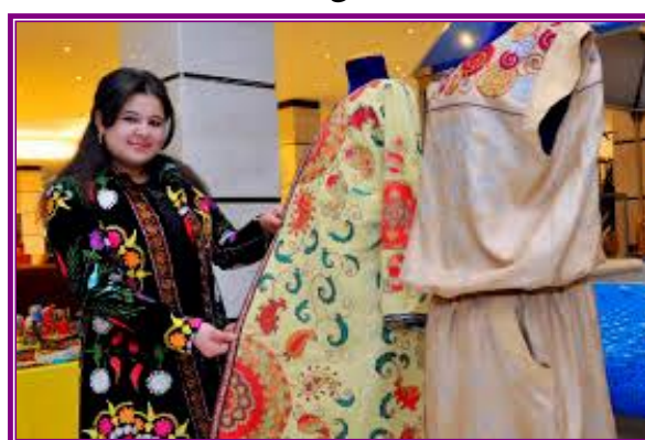
5-rasm. Kashtachilik san`ati

Xulosa o`rnida shuni ta`kidlash joizri, O`zbek milliy kashtalari xalqimiz tarixi, milliy mentalitetimiz bilan uzviy bog`liq bo`lib, yillar mobaynida otabobolarimizdan bizgacha yetib kelgan amaliy san`at turlaridan biridir. Shunday ekan, ming yillardan buyon avloddan-avlodga o`tib kelayotgan kashtachilik san`atini hozirgi o`sib kelayotgan yoshlarga o`rgatish va milliy an`analarimizni davom ettirish har birimizning muqaddas burchimizdir.