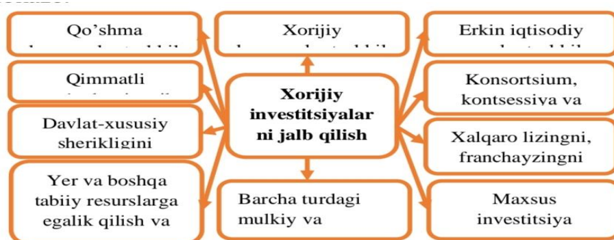
1-rasm. Jahon amaliyotida iqtisodiyotga xorijiy investitsiyalarni jalb qilish shakllari[11]

Milliy iqtisodiyotga xorijiy investitsiyalarni jalb etishda ham asosiy e'tiborni ularning real investitsiyalar shaklida ko‘proq kirib kelishga qaratish lozim. Chunki investitsiyalarning real ko‘rinishda ko‘proq kirib kelishi mamlakatda fan-texnika taraqqiyotining, texnologik o‘zgarishlarning jadallashuviga imkon beradi. Aytish lozimki, bevosita xorijiy investitsiyalarni iqtisodiyotga jalb qilish ilg‘or ishlab