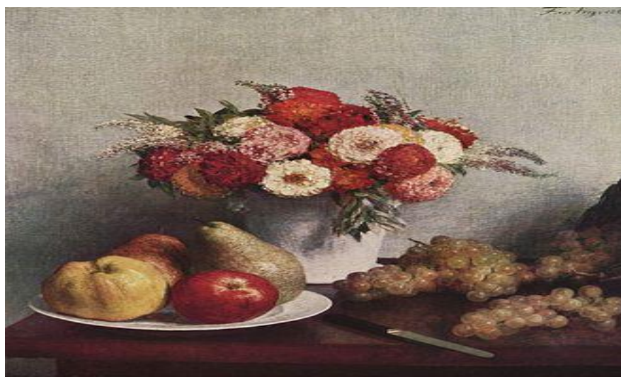
Anri Fanten-Latur “Mevali va gulli naturmort”

Mutaxassislar natyurmortning kishilarga ikki xil ta’sirini qayd etishadi. Birinchisida, natyurmort kishilarni go’zallika oshno etib, ularni hayotdan zavqlanishga chorlaydi. Agarda u meva-sabzavot va oziq- ovqatlar tasviridan tashkil topgan bo’lsa, tomoshabinga yaxshi kayfiyat va illiqlik baxsh etadi. Ikkinchisida, natyurmort o’zi haqida emas, balki u bilan bog’liq, shaxs uning egasi haqida ma’lumot beradi. Bunday natyurmortlarda kishilar aks etmasa-da, biroq, uning didi, ijtimoiy mavqei ifodalanadi. 5