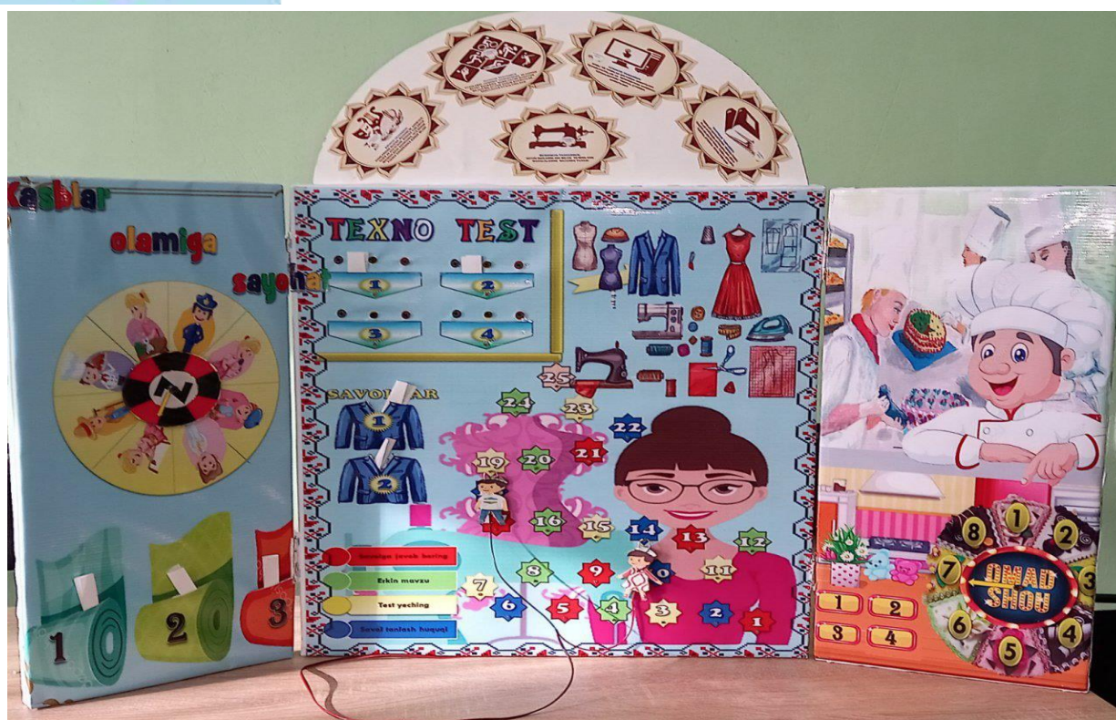
3-rasm. Texnologiya faniga moslangan innovatsion ko'rgazma

O'qituvchi ko'rgazmani orqa tomonidan test variantlarini xoxlagan vaqtda o'zgartirib borish imkoniyatiga ega.